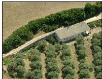
Nurallao, Veduta della realtà

REALIZZAZIONE MURO DI SOSTEGNO A MENSOLA NELL'AZIENDA AGRICOLA PIBITZOI NEL COMUNE DI NURALLAO