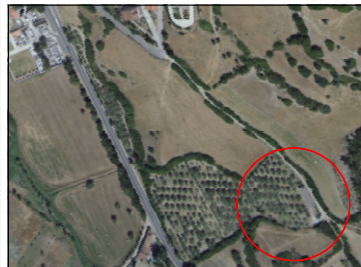
Stralico Ortofoto della zona di intervento, Scala 1:2000