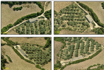
Immagini aeree, Identificazione dell'area di intervento