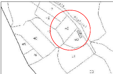
Stralico catastale e individuazione del mappale di riferimento (Foglio 21 Mappale 48), Scala 1:2000