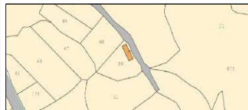
Mappe catastale, Raster unico (Foglio 21 Mappale 48), Scala 1:2000

CONSIDERAZIONI SULL'INQUADRAMENTO GENERALE Le immagini mostrano una chiara identificazione catastale, territoriale ed urbanistica dell'area di intervento. L'azienda agricola Pibitzois risulta essere posta in zona periferica rispetto al centro abitato. Infatti l'area si raggiunge percorrendo una strada sterrata parallela alla SS 128 (direzione Ial). Dal punto di vista della zonizzazione del centro abitato, lo stabile risulta nella Zona E, Sezione E5. Sono previsti per l'azienda agricola nelle quali viene ravvisata l'esigenza di garantire condizioni adeguate di stabilità ambientale.